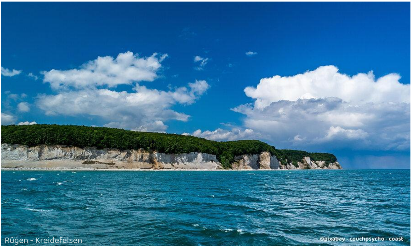
Rügen - Kreidefelsen