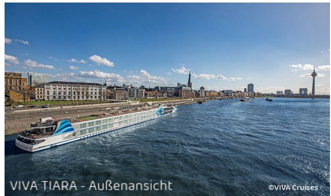
VIVA TIARA - Außenansicht