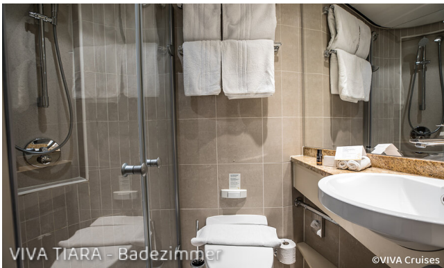
VIVA TIARA - Badezimmer