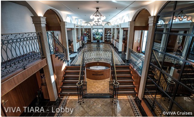
VIVA TIARA - Lobby