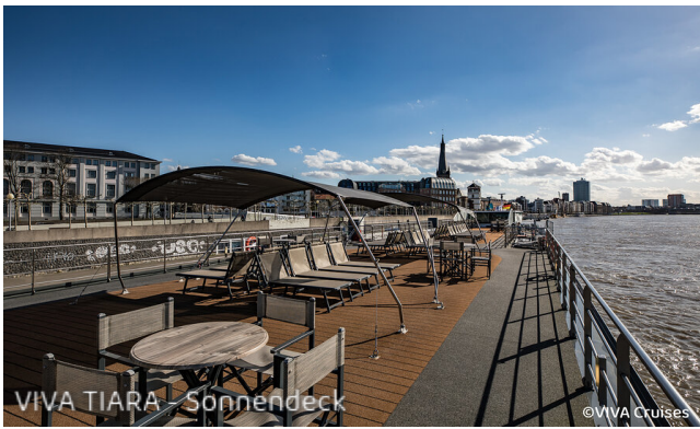
VIVA TIARA - Sonnendeck