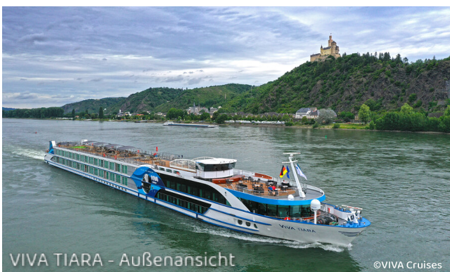
VIVA TIARA - Außenansicht