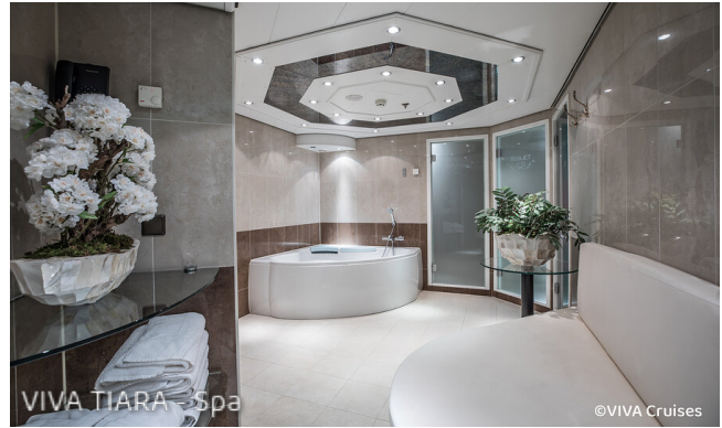
VIVA TIARA - Spa